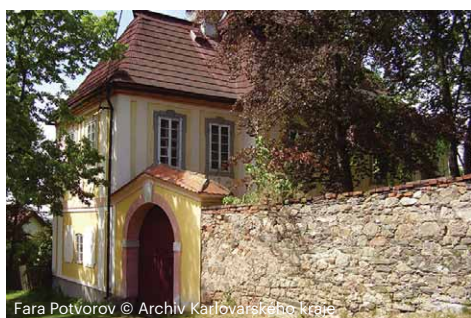
Fara Potvorov