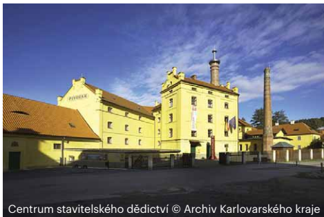
Centrum stavitelského dědictví

Kdyby Jan Blažej Santini realizoval svůj projekt na přestavbu kláštera v Plasích podle svých původních představ, stál by dnes v místech kostela Nanebevzetí Panny Marie jeden z největších chrámů v Česku. Původní románskou baziliku chtěl Santini zcela zbourat – a viděno dnešním pohledem by to byla škoda. Po architektonické stránce je totiž kostel jediným příkladem cisterciáckého stylu u nás. V barokně zařízeném interiéru můžete obdivovat díla nejvýznamnějších českých barokních malířů Karla Škréty a Petra Brandla nebo unikátní varhany, které se svými 29 znějícími rejstříky patřily ve své době k největším v Čechách.