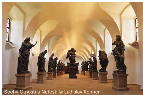
Sochy Ctností a Neřestí