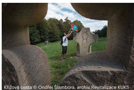
Křížová cesta