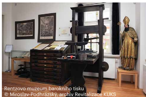
Rentzovo muzeum barokního tisku