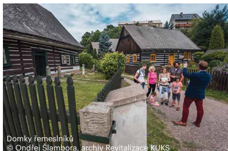
Domky řemeslníků