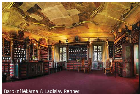
Barokní lékárna