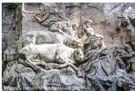
Braunův betlém