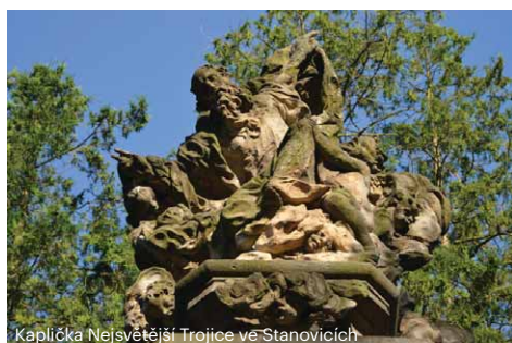
Kaplička Nejsvětější Trojice ve Stanovicích