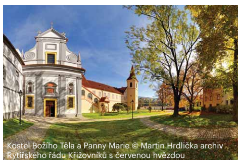
Kostel Božího Těla a Panny Marie © Martin Hrdlička archiv Rytířského řádu Křižovníků s červenou hvězdou

📍 Více info viz http://klasteryck.cz/z-historie-klasteru/