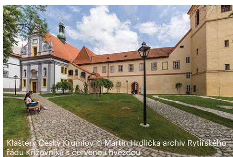
Kláštery Český Krumlov