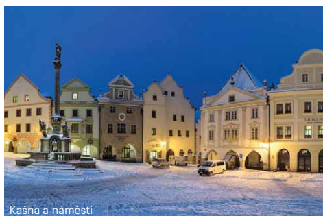
Kašna a náměstí