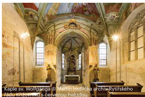
Kaple sv. Wolfganga

Raně barokní průčelí kostela po rekonstrukci září novými barvami. Za ojediněle řešenou iluzivně mramorovanou fasádou najdete uvnitř v kostelní lodi jedinečnou ukázkou barokních uměleckých děl. Kromě bohatě zdobeného hlavního a několika bočních oltářů můžete obdivovat barokní kazatelnu s výjevy ze života sv. Františka a Zvěstováním Panně Marii.