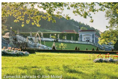
Zámecká zahrada