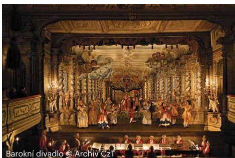
Barokní divadlo

S životem na zámku v době baroka vás seznámí první prohlídková trasa, která ve své druhé části vede interiéry schwarzenberského barokního apartmá z 18. století s původním zařízením. Prohlídka končí v nádherném rokokovém Maškarním sále.