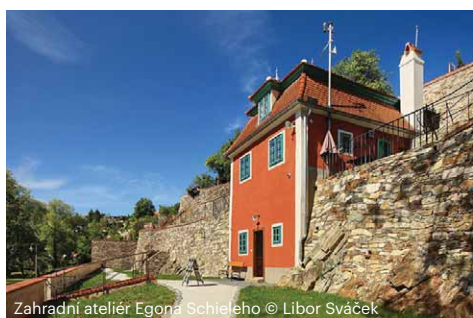
Zahradní ateliér Egona Schieleho