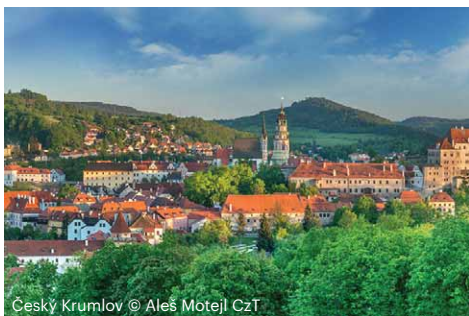
Český Krumlov